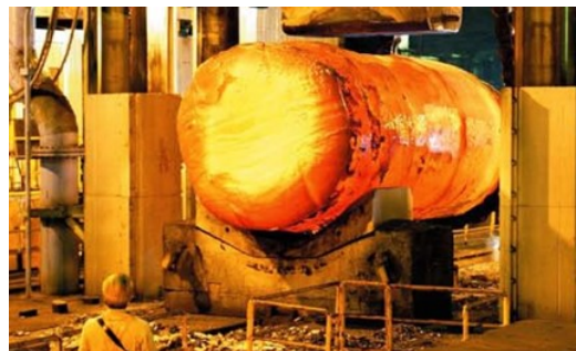
世界最大級の670tの鋼塊