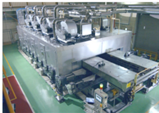
フィルム・シート製造装置